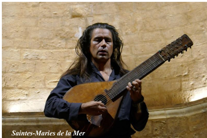
Saintes-Maries de la Mer

Xinarca offre un répertoire autour du chant traditionnel corse (« Cantu nustrale ») monodique : chants sacrés, chants de montagne (chants de bergers, chants de travail), compositions.